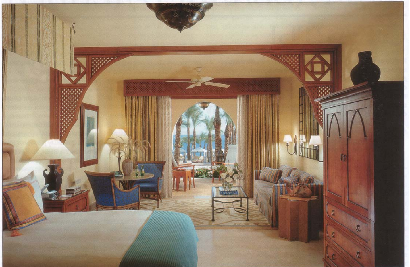
Интерьеры отеля Four Seasons