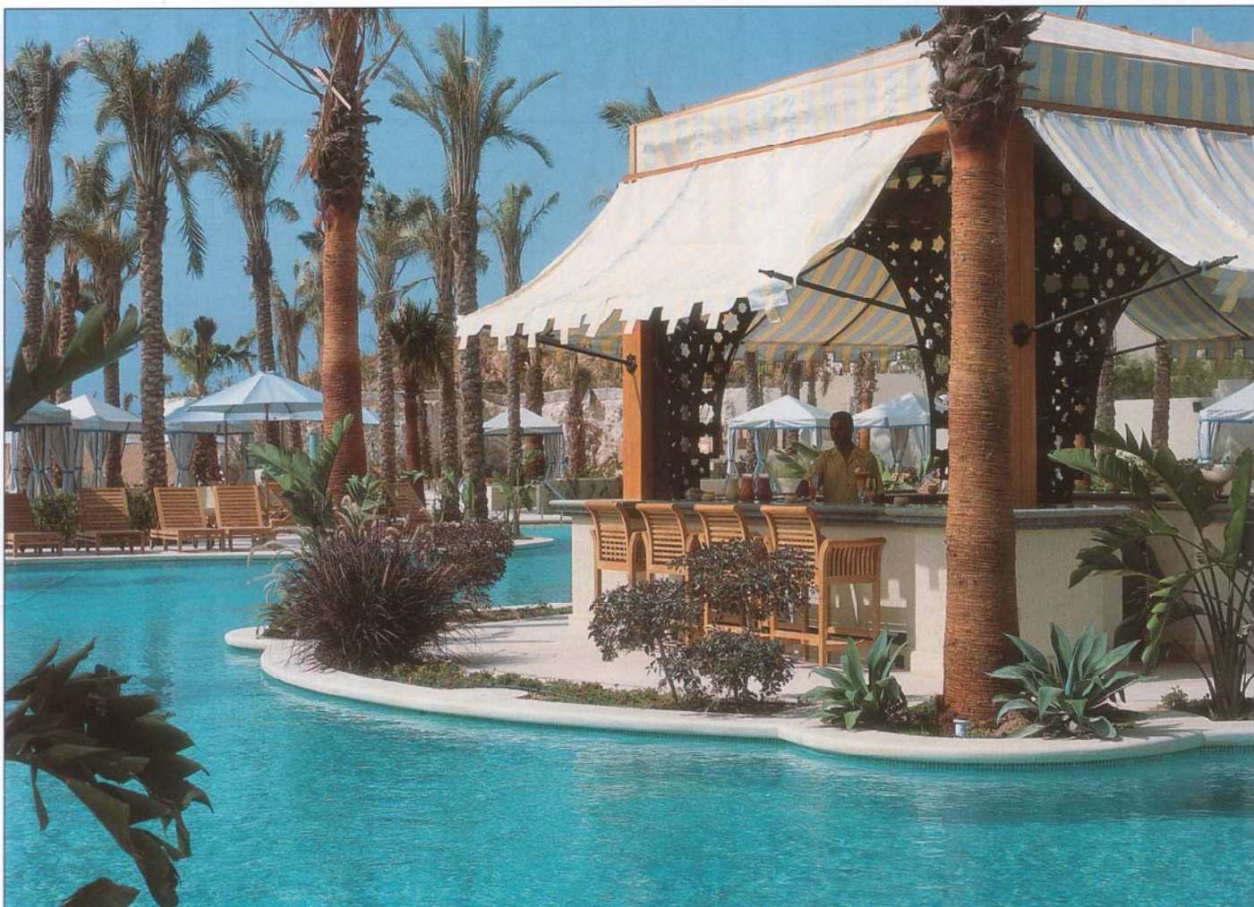
Из такого бассейна выплывать не хочется

предусмотрены все условия не только для отдыха, но и для проведения корпоративных мероприятий, конференций, семинаров и других бизнес-встреч. Конференц-залы различной вместимости оборудованы по последнему слову техники. В номерах отелей есть доступ к сети Интернет.